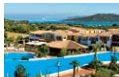
iGV Club Santaclara Sardegna