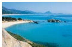
iGV Club Santagiusta Sardegna