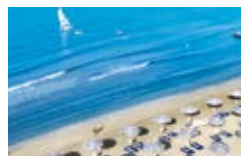
iGV Club Marispica Sicilia