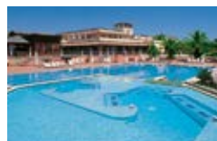
iGV Club Baia Samuele Sicilia

Le promozioni sono soggette a disponibilità limitata, non sono cumulabili con altre iniziative e si intendono valide esclusivamente per soggiorni minimi di 7 giorni. Eventuali cambi di nomi dove ci sia emissione di biglietteria aerea o di date comporteranno la perdita del diritto alla promozione. Eventuali tasse e oneri addizionali sono sempre esclusi. Per maggiori dettagli chiedi in agenzia.