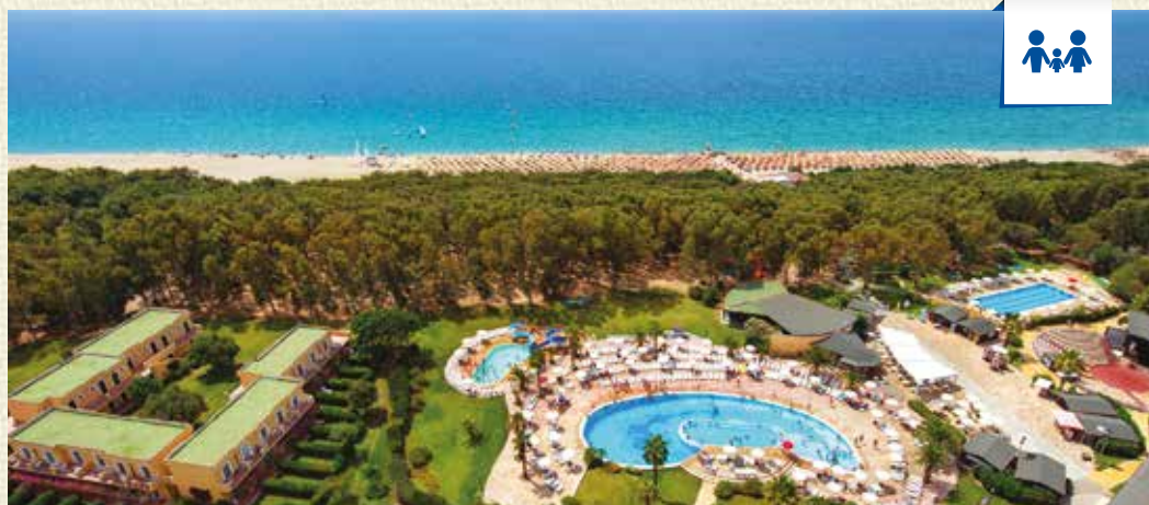
Quote a persona prezzo finito - 7 notti / Pensione completa Bluserena