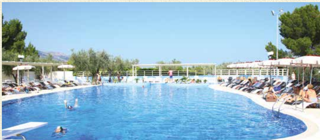
Quote ad appartamento - 7 notti / Solo locazione